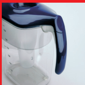
травмобезопасная ручка, снижающая нагрузку на суставы рук