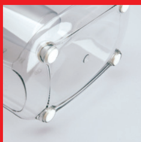
резиновые вставки на дне кувшина обеспечивают устойчивость

Фильтрующий картридж кувшина вставляется в воронку оригинального дизайна, обеспечивающую постоянное нахождение нижней части картриджа в воде. Это предотвращает высыхание угля и смолы, находящихся в картридже, и потерю ими фильтрующих свойств при перерывах в использовании фильтра. Верхняя часть фильтрующего картриджа имеет силиконовое уплотнительное кольцо, исключающее протекание нефильтованной воды минуя картридж.