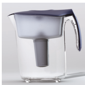
Кувшин Sochi, синий