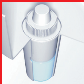
картридж не пересыхает благодаря особой конструкции