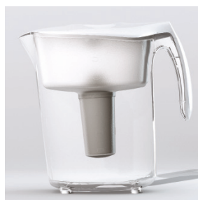
Кувшин Sochi, белый